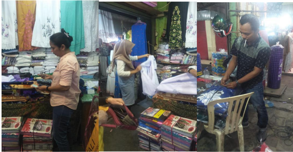
Gambar 3 Gambar Pelanggaran Penggunaan Masker Di Pasar Raya Padang

rendahnya kepercayaan masyarakat terhadap pemerintah dan rendahnya kesadaran masyarakat untuk mengikuti himbauan pemerintah untuk menerapkan protokol kesehatan. Hal ini dapat dibuktikan melalui dokumentasi berikut: