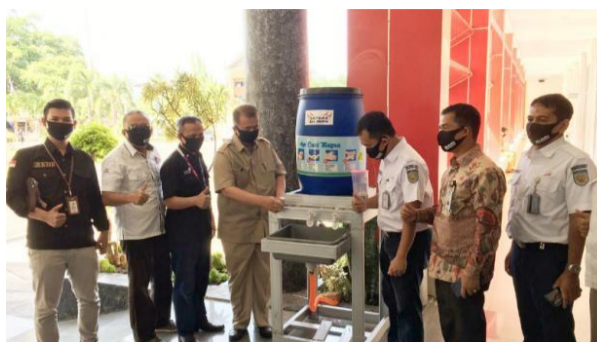
Gambar 2 Keterlibatan Semen Padang

pihak swasta. Dalam pelaksanaannya semua stakeholder tersebut memiliki perannya masing-masing dengan tetap berkomunikasi dan berkoordinasi satu sama lain.