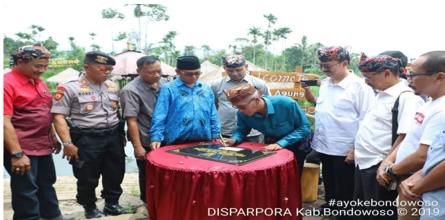
Gambar 1. Peresmian Desa Wisata Tirta Agung