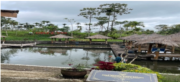
Gambar 5. Sarana Prasarana yang Masih Belum Diperbarui

Akan tetapi komitmen yang terlihat dalam kolaborasi pengelolaan Desa Wisata Tirta Agung saat ini masih kurang kuat dari pihak pemerintah desa. Pemerintah desa sudah berkomitmen kuat untuk mengembangkan Desa Wisata Tirta Agung dengan melakukan pembangunan keberlanjutan sarana dan prasarana yang ada di Desa Wisata Tirta Agung. Akan tetapi melihat fenomena kondisi sarana prasarana saat ini masih belum adanya perbaikan seperti jembatan gazebo apung perlu adanya perbaikan.