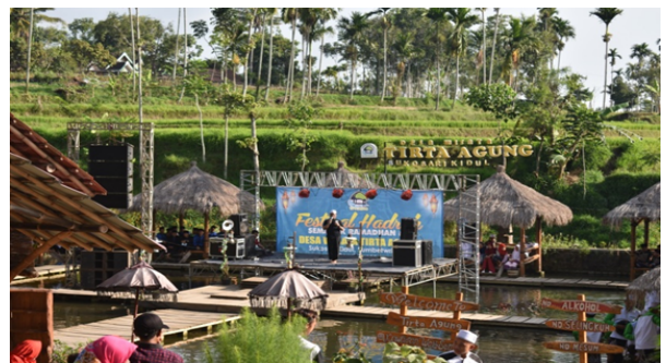
Gambar 4. Acara Event di Kawasan Desa Wisata Tirta Agung

Komitmen ini berkaitan dengan pengakuan masing-masing bahwa mereka memiliki ketidakseimbangan sumber daya. Komitmen pemerintah desa yakni terus melakukan Upaya pengembangan Desa Wisata Tirta Agung dengan melakukan Pembangunan keberlanjutan, sedangkan dari pihak Pokdarwis memiliki komitmen menjalankan tugas sebagai pengelolaan Desa Wisata Tirta Agung seperti meningkatkan kunjungan wisatawan melakukan promosi dengan membuat akun media sosial Desa Wisata Tirta Agung maupun mengadakan event-event yang diselenggarakan di kawasan Desa Wisata Tirta Agung.