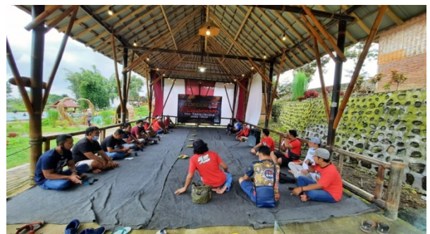
Gambar 3. Kegiatan Musyawarah yang Didampingi Stakeholder mengenai Kegiatan yang Diselenggarakan di Kawasan Desa Wisata Tirta Agung

Musyawarah ini selalu dilakukan 4 pertemuan per 3 bulan. Pelaksanaan musyawarah dihadiri oleh kepala desa, pihak BUMDes, ketua Pokdarwis, anggota Pokdarwis. Akan tetapi waktu musyawarah yang dilakukan fleksibel jika akan mengadakan kegiatan di kawasan Desa Wisata Tirta Agung. Pokdarwis juga terkadang mengikuti pertemuan lembaga kemasyarakatan untuk mengadakan kegiatan di kawasan Desa Wisata Tirta Agung.