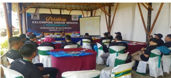
Gambar 6. Pelatihan Pokdarwis

Pemahaman antara stakeholder mengenai visi misi dan tujuan adanya Desa Wisata Tirta Agung memiliki kesamaan yakni mengembangkan Desa wisata di Desa Sukosari Kidul bertujuan untuk meningkatkan pendapatan asli desa maupun perekonomian masyarakat Desa Sukosari Kidul. Pemahaman kesamaan stakeholder yang terlihat pada pengelolaan Desa Wisata Tirta Agung, dimana pemerintah desa melakukan pembinaan maupun pelatihan Pokdarwis.