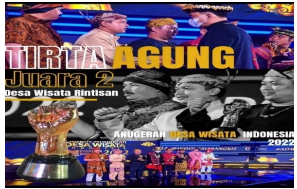
Gambar 7. Pencapaian Prestasi Desa Wisata Tirta Agung

Adanya kolaborasi pengelolaan Desa Wisata Tirta Agung, jika dilihat perkembangan saat ini Desa Wisata Tirta Agung mendapatkan pencapaian prestasi berhasil menjadi juara 2 dalam Anugerah Desa Wisata Indonesia (ADWI) tahun 2022 kategori desa wisata rintisan tingkat nasional.