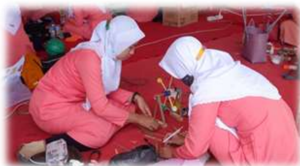
Gambar 5. Proses Pembuat alat peraga edukatif