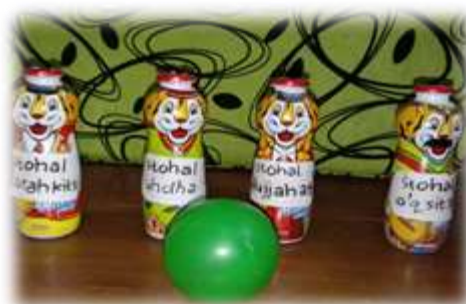
Gambar 4. Permainan Bowling dari Botol Bekas Minuman Susu Anak