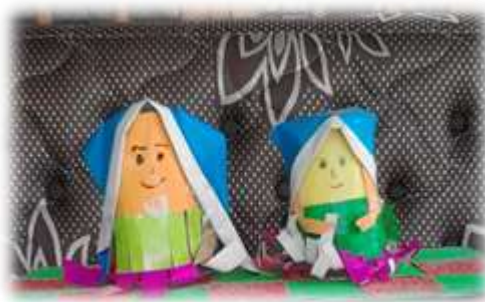
Gambar 3. Boneka Sandiwara dari Bekas Gelas Aqua