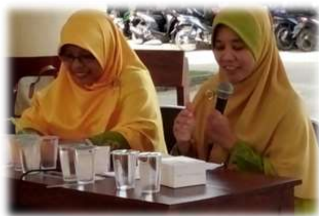
Gambar 1. Penyampaian Materi oleh Pemateri

point; (2) contoh alat permainan edukatif (APE) menggunakan barang bekas peminatan pemateri dalam bentuk barang jadi; dan (3) Media untuk praktik sebagai penerapan dalam pembuatan alat permainan edukatif (APE) menggunakan barang bekas peminatan, yang terdiri dari aqua gelas, kaleng susu, botol minuman, dan bambu bekas.