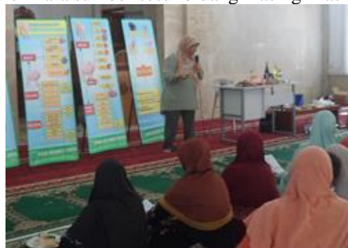
Gambar 2. Sosialisasi sesi pertama pemateri dari BPPOM

Grafik pada gambar satu menunjukkan bahwa terjadi peningkatan nilai rata-rata yaitu dari 44,9 saat pretest (sebelum pelatihan) menjadi 73,5 pada pos test (setelah pelatihan). Pelaksanaan kegiatan ditunjukkan terdiri dari sosialisasi kehalalaln makanan kesehatan makanan dan lain sebagainya yang di isi oleh nara sumber sesuai bidang masing-masing pada Gambar 2.