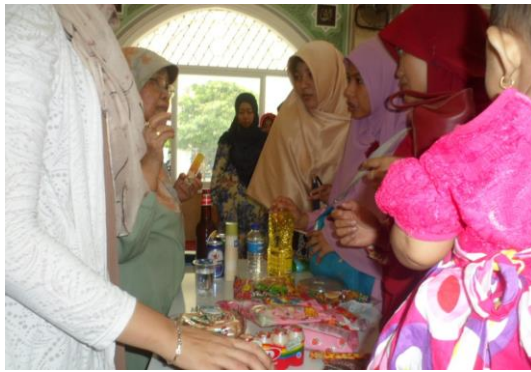
Gambar 4. Pelatihan identifikasi kehalalan produk

Sosialisasi menghadirkan pembicara profesional terdiri dari: