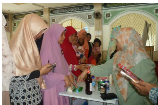
Gambar 3. Pelatihan kehalalan produk

Pelaksanaan kegiatan di ikuti oleh peserta dengan cukup antusias mengikuti pelatihan karena umumnya mereka belum banyak mengetahui tentang kehalalan sehingga saat pemberian materi maupun saat diskusi terdapat banyaknya pertanyaan yang diberikan pada sesi diskusi (Gambar 3). Selain itu belum pernah ada pelatihan serupa yang mereka ikuti selama ini.